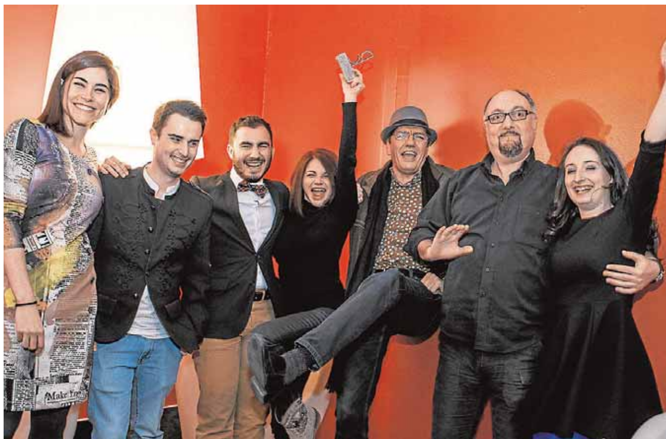
El director de cine Antonio Cuesta -en el centro- junto a los actores del reparto del cortometraje «Angélica»

dor de 33.000 euros, reformas y mejoras en parques públicos con un presupuesto de 353.000 euros, así como la ampliación en unos 800 metros de la red viaria existente de carriles bici y la reparación de algunos tramos que se encuentran deteriorados.