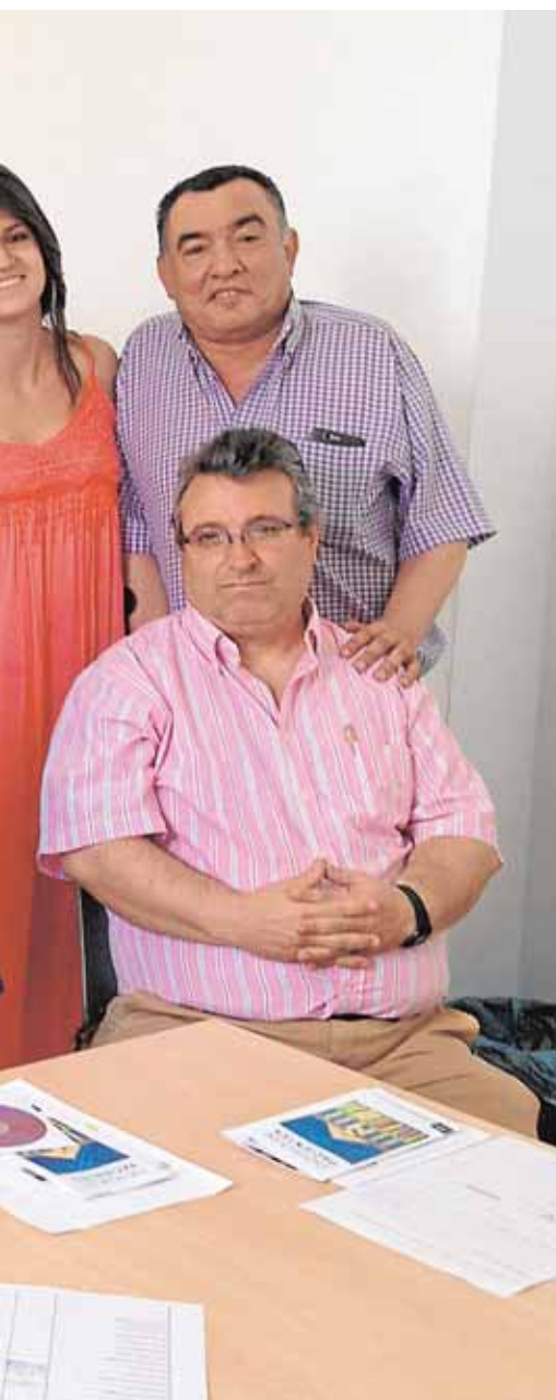
entes en Écija

cifra más baja de los últimos seis meses. La anterior la encontramos en noviembre del pasado año, con 521. Por géneros, son las mujeres las que presentan un mayor número de desempleo, 291, por los 272 de los hombres.