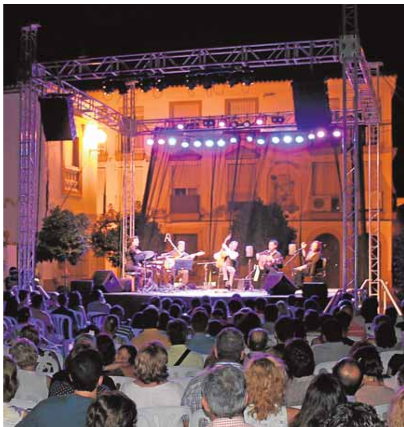
La plaza de Gibaxa, sede de los espectáculos de «Utrera Suen» ALBERTO FLORES

Con el paso de los años la escuela internacional de música clásica y flamenco «Utrera Suen» se ha convertido en una cita de referencia en la localidad, tanto en su vertiente formativa como en su dimensión más lúdica. Hace unos años, pocos confiaban en que la apuesta de «Utrera Suen» pudiera materializarse, pero lo cierto es que se ha convertido en una de las citas más importantes del año en el panorama cultural utrerano. El número de alumnos se ha mantenido en cifras similares a años anteriores, encontrándose en torno a los 40.