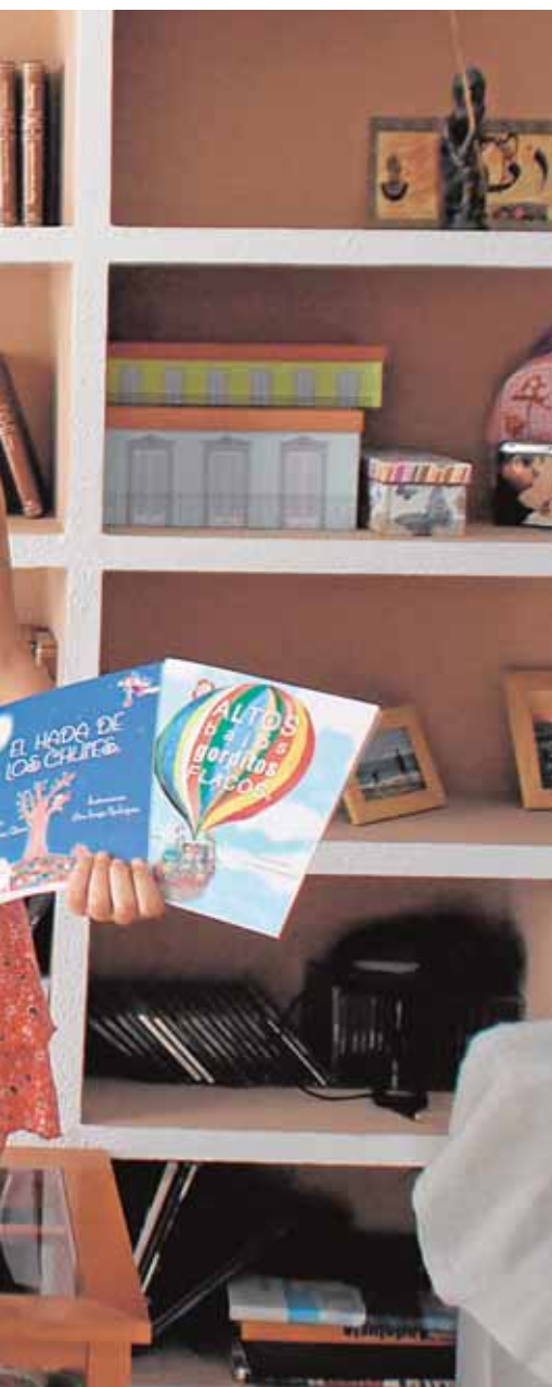
dos que han ideado

convierte en uno de los municipios de una gira que llevará a Mr. Iglú a recorrer las provincias de Sevilla, Huelva y Córdoba. Se trata de una propuesta cuya finalidad es concienciar para la mejora del reciclaje, sobre todo en el ámbito doméstico.