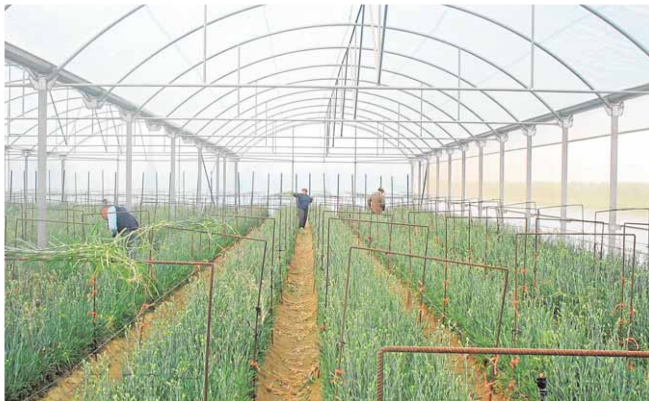
Los trabajadores discapacitados mentales trabajando en la parcela que Ajudisle tiene en las marismas

Estos productos unidos a las compras realizadas desde el Ayuntamiento (alimentos perecederos y de higiene personal) suponen un importante alivio para muchas familias que están pasando dificultades económicas.