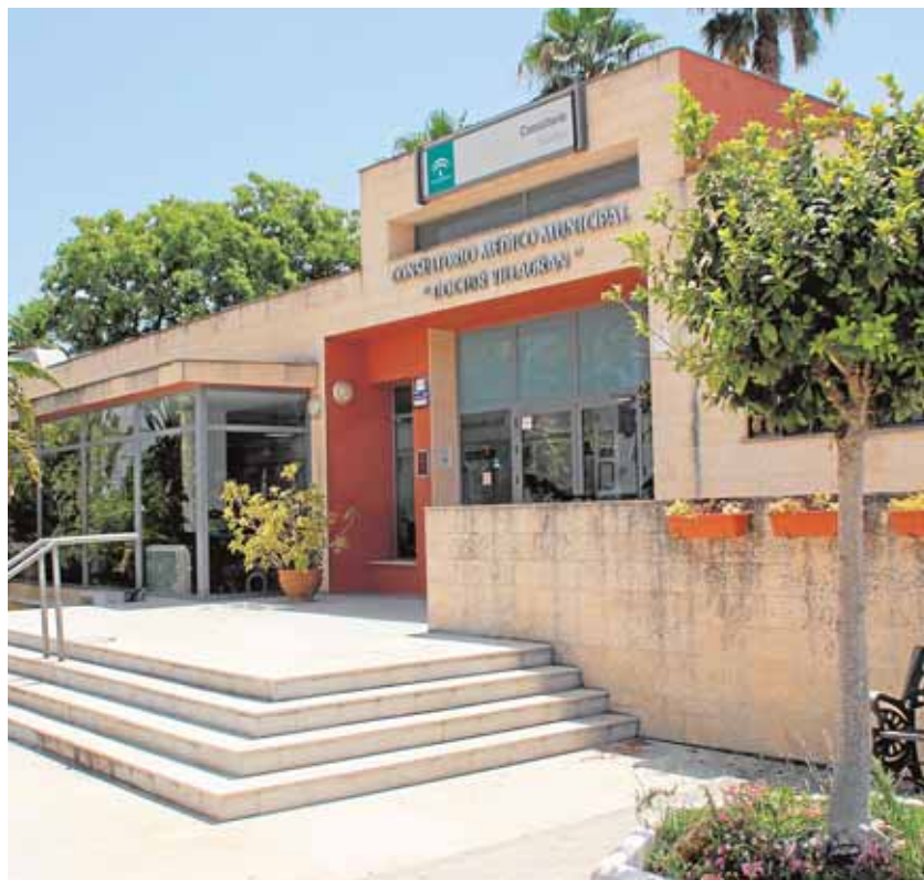
Consultorio médico «Doctor José María Villagrán», de Espartinas

El alcalde espartinero acudió al centro para reunirse con varios trabajadores, quienes le expusieron las necesidades del centro. El primer edil