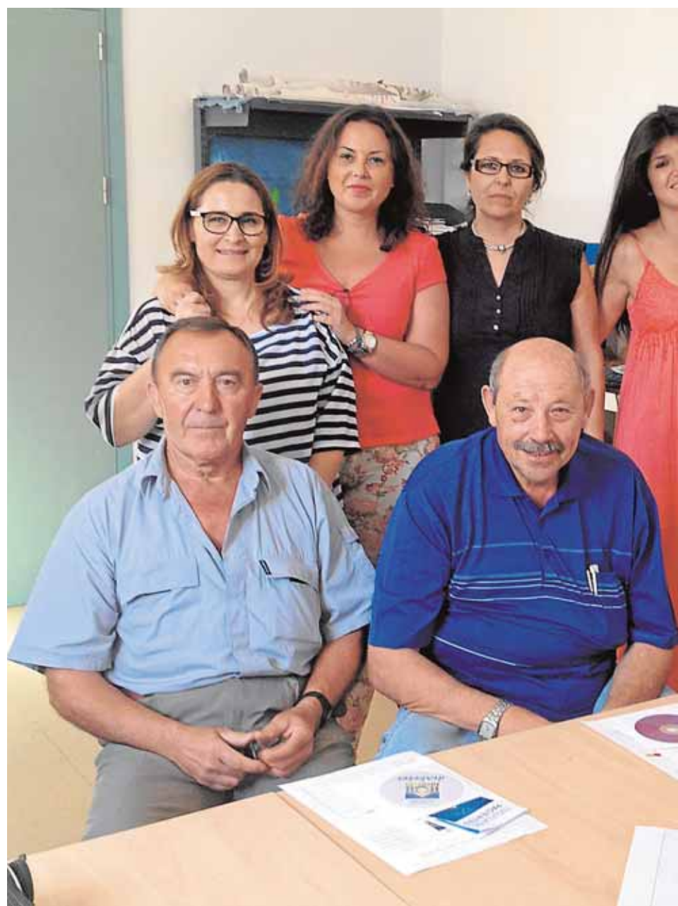
Los pacientes diabéticos participan en la segunda edición de las escuelas de pacien-