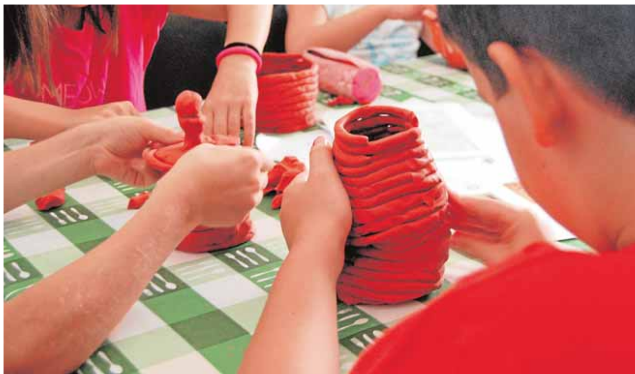
Los niños reproducen las tareas que realizaban los hombres de la Prehistoria

La siguiente meta de La Andaluza será pronto una realidad: la primera taberna fuera de España, que abrirá en la ciudad de Oporto. Y seguirá creciendo, porque según adelanta Espinosa a ABC Provincia, «ya tenemos ofertas en firme de Italia e Inglaterra».